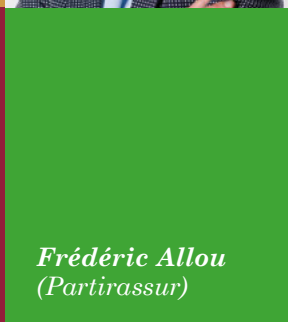
Frédéric Allou (Partirassur)