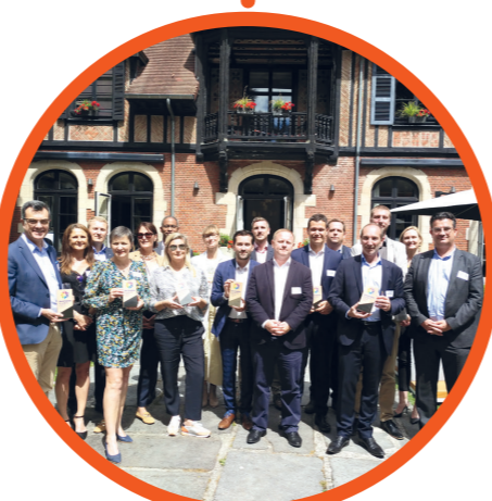
Journée d'été Nord