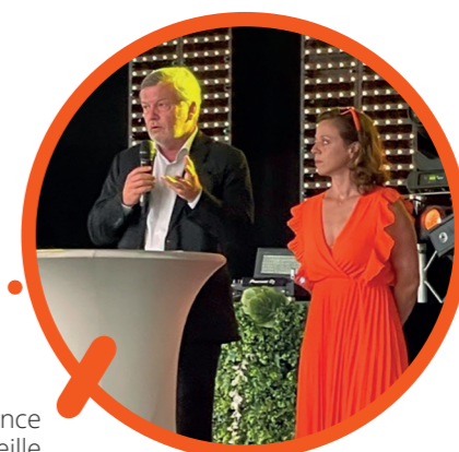
Soirée de l'assurance Marseille

Merci aux nombreux partenaires qui ont accompagné nos Collèges et nos actions en régions durant cette année : Aésio Mutuelle, Albingia, Alpen Expertises, Alptis, CAM Groupe, Carglass, CEMI union d'expert, CFDP, CGPA, CHOL expertises, Courtier du Motard, Adenes, Entoria, Galtier expertises, Generali, Groupama, Groupama PJ, Helvetia, J2S, Largillière Finance, L'Auxiliaire, Le Finistère, Malakoff Humanis, Markel, MILA, MMA, One Expert, QBE, SADA, Sedgwick, Skyinlab, Stoik, Veralti.