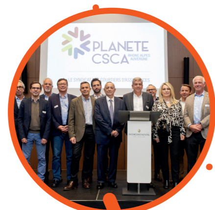
Soirée de l'assurance Lyon