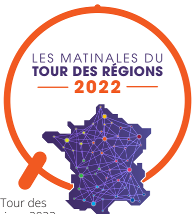
Le Tour des Régions 2022